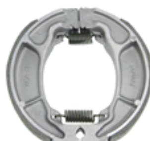
BALATAS DEL/TRAS SET HN GL 150 CARGO (14-19) 42-9202-001