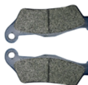
BALATAS DELANTERAS SET YH FZ 16 (11-19) 42-9104-001