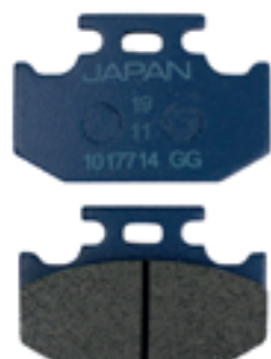
BALATAS TRASERAS SET YH YZ/WR 125/250 42-1061-001