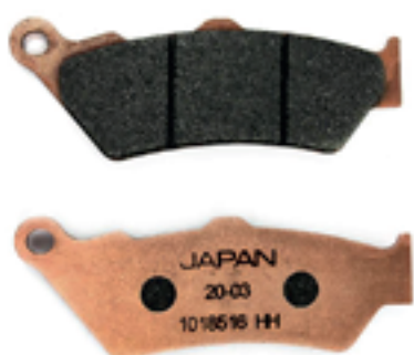
BALATAS DELANTERAS SET BM GS650/800 42-9508-001