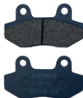
BALATAS DELANTERAS SET IT FT180 42-5683-001