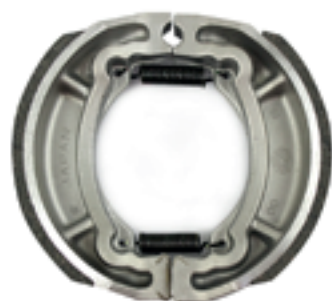
BALATAS DEL/TRAS SET SU AX 100 (07-14) 42-9301-001