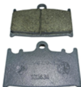
BALATAS DELANTERAS SET KW ZX-6/ZXR750/ZXR900 42-9401-001