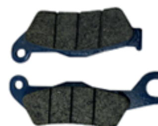
BALATAS DELANTERAS SET HN CB 1 (15-19) 42-9506-001