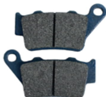
BALATAS TRASERAS SET BJ PULSAR 200 NS(12-19)/BM GS650/800 42-4128-001