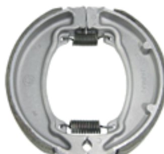
BALATAS TRASERAS SET HN CARGO 125 (97-13) 42-9201-001