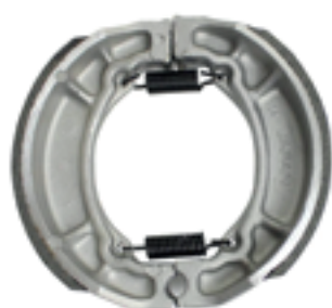
BALATAS DEL/TRAS SET BJ BOXER 150 (08-19) 42-4129-001