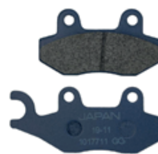
BALATAS DELANTERAS SET IT DS150/125Z/150Z/250Z 42-5684-001