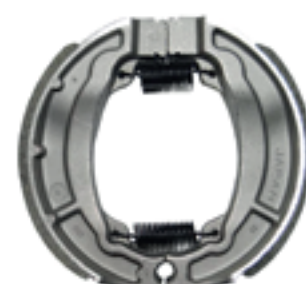
BALATAS DEL/TRAS SET HN CGL 125 TOOL (12-19) 42-9204-001