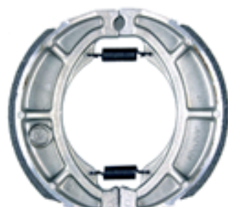
BALATAS DEL/TRAS SET SU EN 125 HU (07-19) 42-9303-001