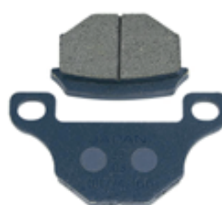
BALATAS DELANTERAS SET SU GN 125H (87-98) 42-9302-001