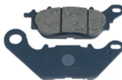
BALATAS DELANTERAS SET YH YBR 125 G (12-19)(DP) 42-9102-001