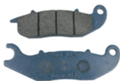
BALATAS DELANTERA SET HN CGR 125 INVICTA (08-10) 42-9205-001