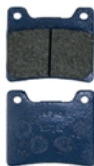
BALATAS TRASERAS SET YH XVS 1100V-STAR (99-16) 42-1062-001