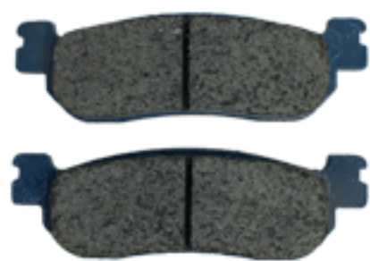
BALATAS DELANTERAS SET YH T110 CRYPTON (13-19) 42-1037-001