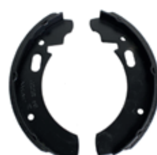
BALATAS TRASERAS TV KING 4S 200 42-5630-001