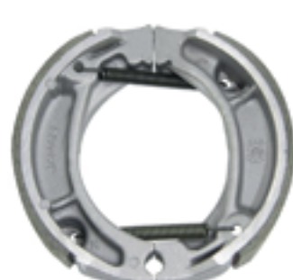
BALATAS TRASERAS SET IT AT 110 (05-16) 42-9502-001