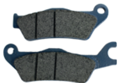
BALATAS DELANTERAS SET SU GIXXER 155 (15-19) 42-3021-001