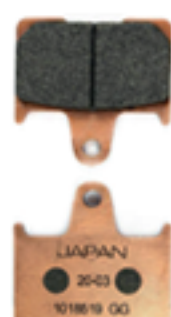
BALATAS TRASERAS SET SU GSXR1000 42-9512-001