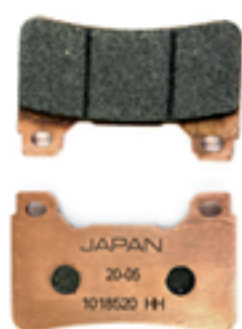
BALATAS DELANTERAS SET HN CBR600RR/1000RR 42-9510-001