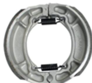
BALATAS DEL/TRAS SET YH YBR 125 CEXPRESS (15-19) 42-9101-001