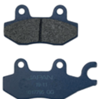
BALATAS DELANTERAS SET IT DM200 42-5686-001