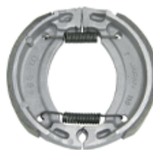
BALATAS DELANTERAS SET IT ATV150 SPORT/150 C/REVER 42-9504-001