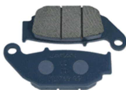
BALATAS TRASERAS SET HN INVICTA 150 (12-16) 42-9206-001