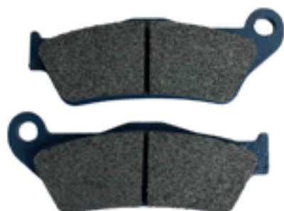
BALATAS DELANTERAS SET BJ PULSAR 200 NS (12-19)(DISCO) 42-4126-001