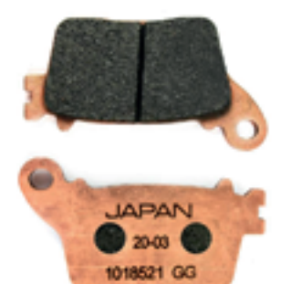
BALATAS TRASERAS SET HN CBR600RR/CBR1000RR 42-9507-001