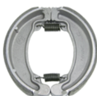
BALATAS TRASERAS SET IT FT 150 (13-16) 42-9501-001