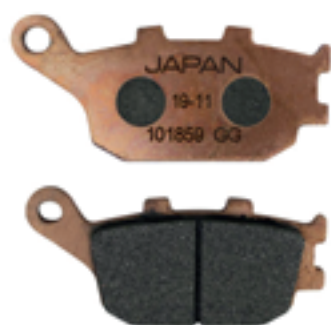
BALATAS TRASERAS SET YH R6/R1 HN CBR600/900 42-1059-001