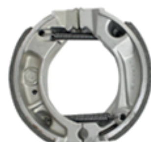
BALATAS TRASERAS SET HN XR 150 L (16-19) 42-2207-001