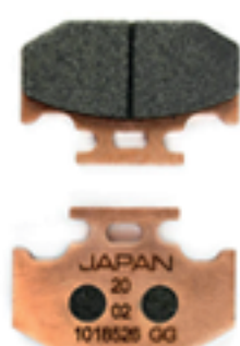
BALATAS TRASERAS SET YH YZ/WR 125/250 42-9509-001