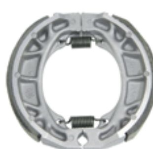
BALATAS DEL/TRAS SET IT FT 125 (05-12)/ CS 125 (05-18) 42-9503-001