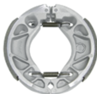
BALATAS TRASERAS SET YH FZ 16 (11-19) 42-9103-001