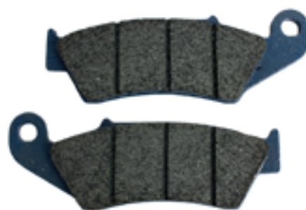
BALATAS DELANTERAS SET HN XR 150 L (16-19)(DISCO) 42-2205-001