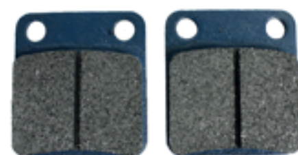
BALATAS DELANTERAS HN CG 125 F (DISCO) 42-2206-001