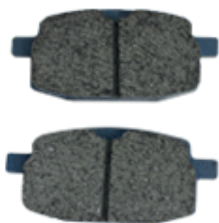
BALATAS DELANTERAS SET YH BWS 100 (05-14)/ IT WS 150 (08-19) 42-1035-001